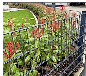
Beispiel für eine „kombinierte“ Einfriedung.