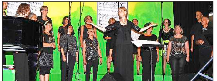
Der Pop- und Jazzchor überzeugte durch hervorragenden Gesang, konnte aber leider nicht in Vollbesetzung auftreten.

Nach der Pause wurde das Programm mit Concordia alleine gestaltet. Mit Songs wie „I'll be watching you“, „what the world needs now“ überzeugten sie durch sehr korrekte