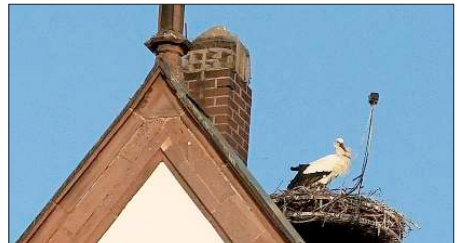
Nach seinem Jungfernfug vom Dach der Georgskirche wird Jungstorch „Biene“ bald seine große Reise in den Süden antreten.

Zum Bedauern aller Storchfreunde sind auf dem 27 Meter hohen Storchenturm nun bereits im dritten Jahr nacheinander keine Störche aufgewachsen. Alle fünf ausgeschlüpften Störchlein sind verendet, weil sie von den Altvögeln nicht richtig betreut und gefüttert wurden.